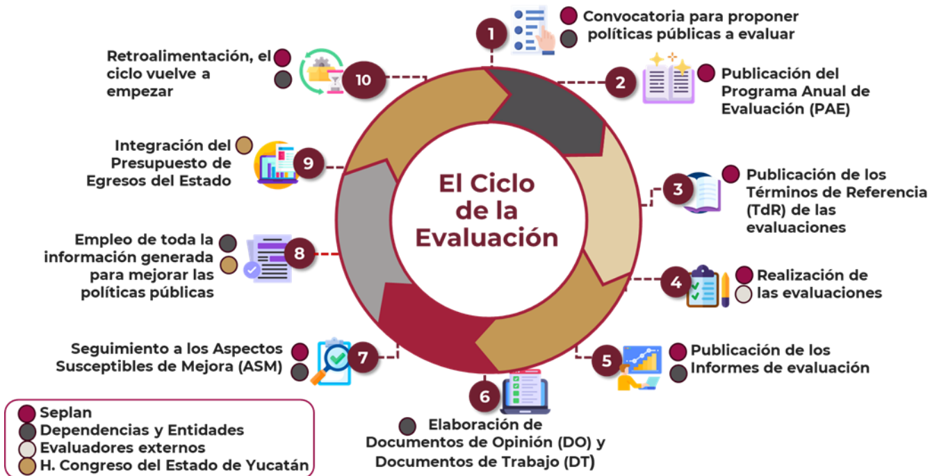
Ilustración 1. El ciclo de la evaluación en Yucatán.

El ciclo de la evaluación (Ilustración 1) inicia cada ejercicio fiscal con la convocatoria para que las dependencias y entidades de la APE propongan sus intervenciones públicas para ser evaluadas y concluye con el uso de información generada en la toma de decisiones presupuestales.